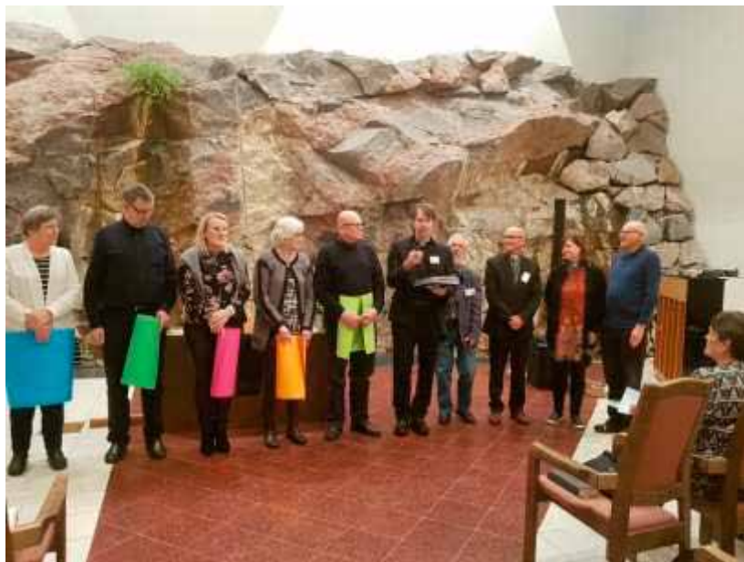
Laitilan joukko toivottamassa koko katulähetysväen tervetulleeksi Laitilan Kesäpäiville: "Tulkaa meill Laitlahan, me pidetä teistä hyvää huolta, jälle!"