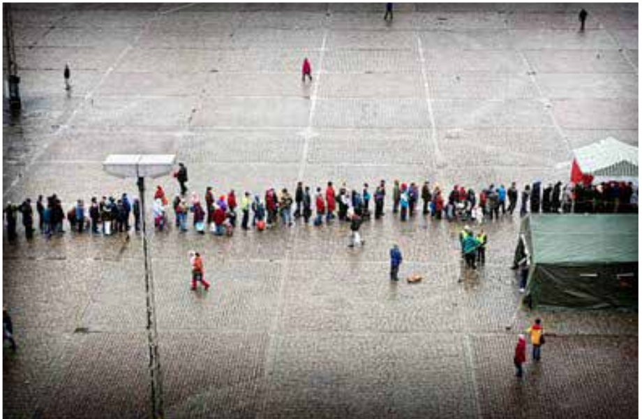
Ruoka-apu Suomen köyhille kasvaa.

Turun Katulähetys ry, Toivonseurakunta, Rauman Seudun Katulähetys, Kouvolan Helluntaiseurakunta, Hangon Katulähetys.