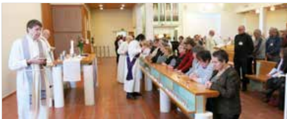
Ehtoollinen Huhtasuon kirkossa.