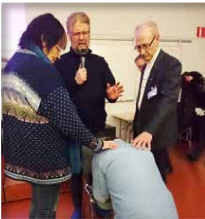
Uuden puheenjohtajan siunaaminen.