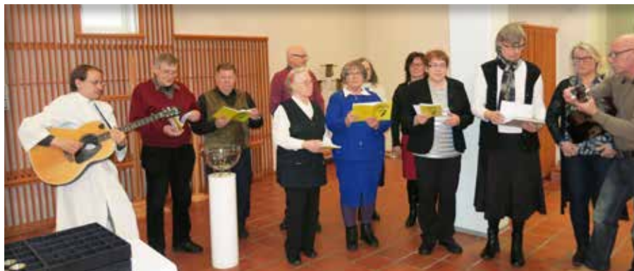
Katulähetyskuoro Huhtasuon kirkossa.